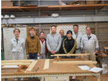
後列は講師、前列研修生

日曜日の授業でも、月1回であり、毎月知らないことばかりで、自分のスキルアップが図れ、大変楽しみにしているため苦にはならないそうです。