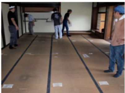
旧中筋家住宅での現地調査

可能、毀損した畳床は締め直して再利用できることを報告。本科・修復専攻科で修得した技術を活かすことができ、その後の研究会活動に弾みがつきました。（立野克典）