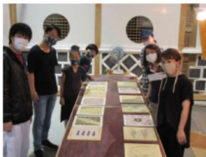
土壁と泥団子作り

昨年9月13日に三密対策で例年より人数を減らして開催。36名の方が9科の職人の指導を受け、伝統的な技の修得に励みました。中には、あと2つの科を受けると9科全部を体験するという方もおられました。