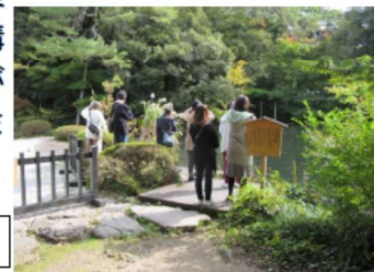
松風閣庭園の霞が池

昨年11月1日に、三密対策として募集人数を少なくし、松風閣庭園・長町 西家庭園・成巽閣飛鶴庭・寺島蔵人庭園で開催しました。多くの市民の応募があり、天候にも恵まれ、紅葉には少し早かったのですが、爽やかな中、造園科講師の説明を聞きながら庭園鑑賞を楽しまれました。