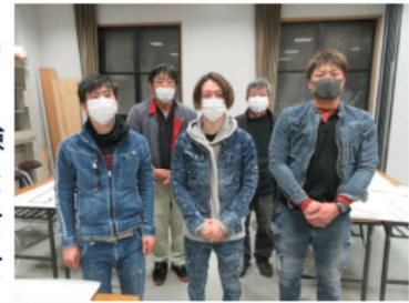
後列は講師、前列研修生

研修内容は、経験したことの無いことばかりですが、とてもやりがいを感じているとの事でした。