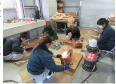
水屋の流しを製作中