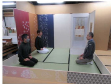
移動式茶室と講師陣

を中心に製作、使用する場所によって模様替えも出来ます。職人大学校でもこれを利用してお茶会を開催したくなりました。