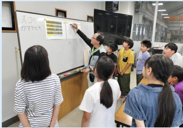
講師から手順の説明を受ける