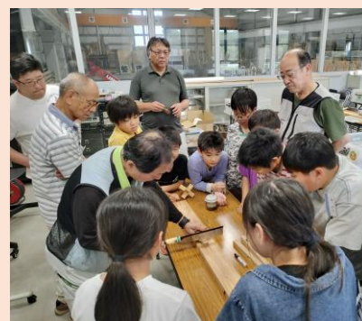
講師から手順の説明を受ける

ノコギリを補助する治具 (ジグ)。 材料と治具を重ねて持つ。 治具のマグネットにノコギリの歯が くっつくので、材料とノコギリの間に 隙間ができない。