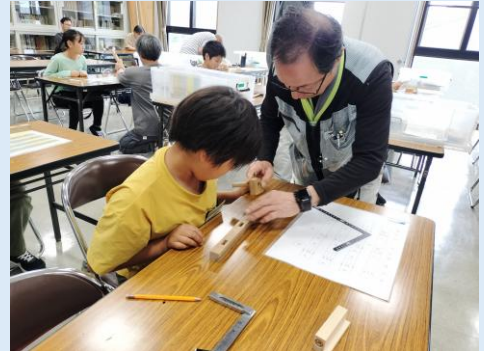
カマケビキの歯で材料に印を付ける