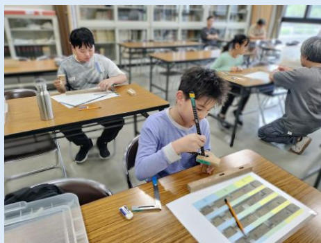
差し金でカマケビキの歯の間隔を測って調整する