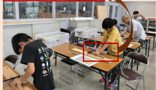
治具を使って材料を切る