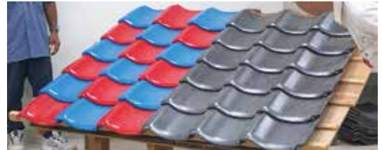
▲演習前に実際にねじれ方向の異なる棧瓦を配置し、隙間がどのように空くかを確認。隙間が大きいほど雨漏りのリスクが高くなり、交互に葺くことで隙間が少なくなる。

研修生は古い瓦を再利用するにも一筋縄ではいかない大変さを感じ取り、瞬時に判別し瓦を葺いていく職人の技に改めて感心していました。実際に見聞きし・体験することで、各々の修復現場を進める上で注意・考慮することを早速思い描いているようで、頼もしい限りでした。