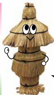
▲こも掛けした燈籠

“ざぶとん”という名前で、木の枝に雪吊りの支柱をのせる時に木が痛まないように敷いて使います。職人さんが雪吊り直前に器用に藁縄で編んでいましたよ。