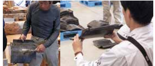
▲打音検査→瓦の全体を叩いた目で目に見えないひびを探す。 ▲ねじれ方向の確認→「しり」を左側に「手前」側からみて跳ね上がっている方向を目視で確認・仕分する。