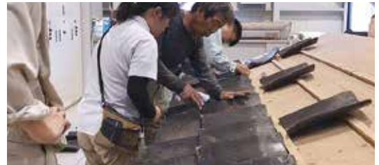
▲瓦葺演習→研修生自身が仕分けた棧瓦を実際に葺いてみる。大きさや反り具合が一枚ずつ異なる為スムーズな配置が難しい。